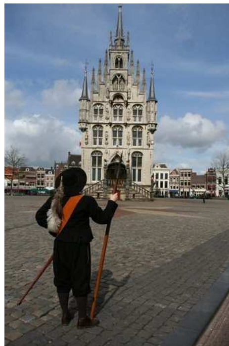
• De poortwachter is op zoek naar de geschiedenis van Gouda.

Na de pilot van vorig jaar, is op 17 april weer een nieuwe reeks van Goudzoekers gestart. Dit educatieve programma van de Brede School Gouda, Historisch Platform en de BAM-instellingen laat kinderen uit groep 7 en 8 kennis maken met de geschiedenis van de stad.