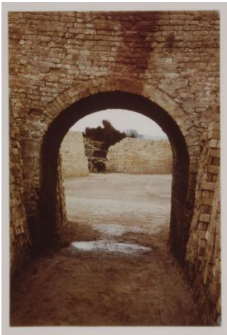
• fotonr. 56408. Een steenoven, ca. 1960.

Het Streekarchief Midden-Holland bezit bovendien een groot aantal foto's van Hitland.